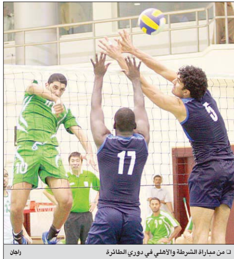
الريان من مباراة الشرطه والاهلي في دوري الطائره

وكان النادي العربي أنهى المفاوضات مع اللاعب البوليفي والذي يلعب في نادي ديپورتيفو البرازيلي وسبق أن لعب في نادي كورينثيانز كما أنه أحد العناصر الأساسية في منتخب بوليفيا ويلعب في مركز الوسط الأيمن، ويبلغ من العمر 23 سنة.